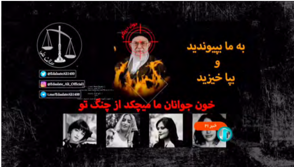
Figure 6 : Panneau au message révolutionnaire apparu lors du journal télévisé de l'IRIB, le 8 octobre 2022.

les verra également enlever les cadres avec les figures des deux guides suprêmes dans leur classe pour jouer à la marelle en sautant à pieds joints à l'intérieur des photographies. Des représentants de l'État se rendront dans les collèges espérant rétablir l'ordre avant d'être chassés sous les huées. En réponse à cette situation, des écoles de jeunes filles seront attaquées au gaz de novembre 2022 à mars 2023. Si la télévision reste un média d'État, elle sera aussi détournée. Le samedi 8 octobre 2022, un panneau s'intercale dans le journal télévisé montrant sur un fond noir le guide suprême, entouré de flammes, une cible sur le front.