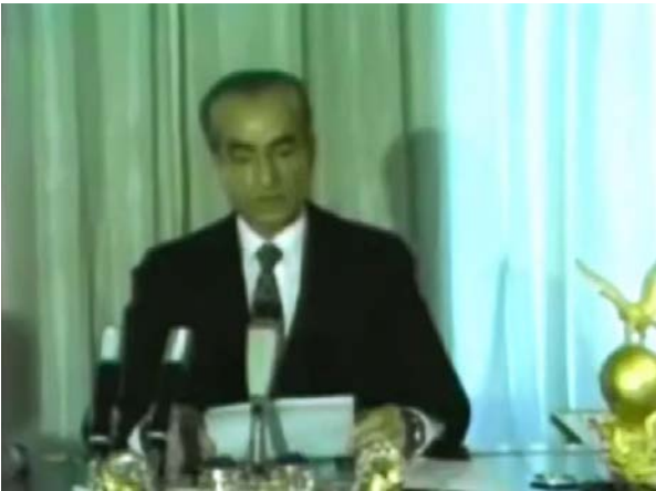
Figure 1 : Allocution télévisée du Shah, le 6 novembre 1978.

Devant la situation de plus en plus tendue, le pouvoir va faire preuve d'attitudes contraires. Du 10 octobre au 6 novembre 1978, on assiste à une libération de l'information. Cette brusque ouverture des médias confirme l'importance de la censure qui dominait jusqu'alors. Le 5 novembre 1978, l'armée intervient devant l'université de Téhéran. On parlera de « Dimanche rouge ». Du 6 novembre 1978 au 2 janvier 1979, les militaires prennent le contrôle de la télévision. Dans ce contexte, le Shah prononce un discours où il s'adresse directement à la nation : « J'ai entendu la voix de votre révolution. La révolution du peuple iranien ne peut qu'avoir mon approbation », dit-il. Cette recherche d'un dialogue apparaît comme l'aveu d'un échec. Ce sera sa dernière intervention publique.