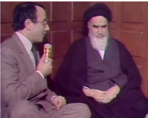
Figure 2 : Interview de Khomeini par Yves Mourousi à Neauphle-le-Château, TF1, 1979.