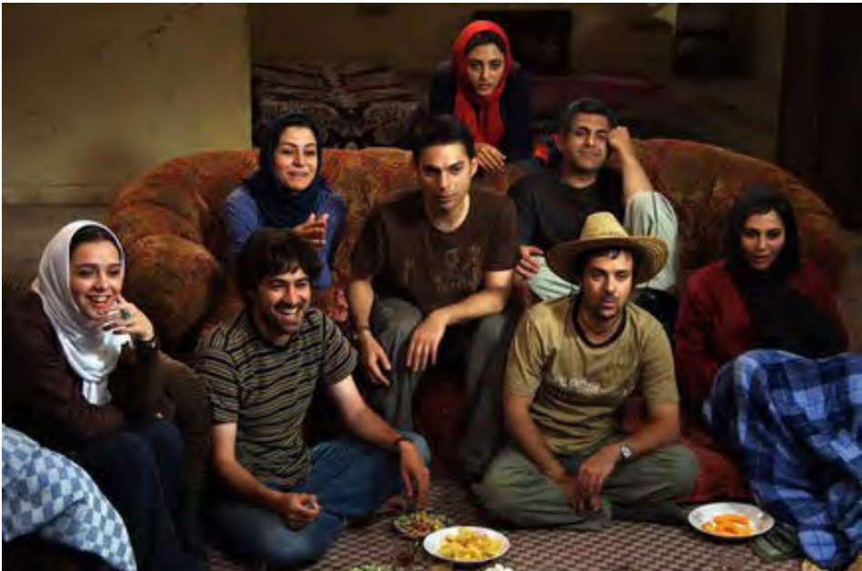
.Figure 4 : À propos d'Elly (2009) d'Asghar Farhadi

à tout espoir de changement. Le lendemain, Neda Agha-Soltan, une jeune femme de 26 ans, est tuée en pleine rue lors d'une manifestation pacifique. L'image de sa mort fait le tour du monde. Reprenant son prénom entendue sur la vidéo, elle sera d'abord surnommée « Neda Azadi » (« l'Appel de la liberté ») avant que l'on connaisse son véritable patronyme. L'image de la mort de Neda marque la fin d'une semaine de contestation. Les procès des manifestants en juillet seront diffusés à la télévision. Une surveillance accrue des gardiens de la Révolution rendra impossible la reprise immédiate du mouvement. Celui-ci ne s'éteindra pas pour autant. À partir du mois de septembre, les manifestants vont détourner la signification des fêtes officielles comme la journée de Jérusalem, le 18 septembre, ou le trentième anniversaire de l'occupation de l'Ambassade des États-Unis, le 4 novembre 2009. Le pic de la contestation sera atteint avec les cérémonies de l'Achoura. Contrairement aux attentes de nombreux Iraniens, le pouvoir parviendra à empêcher tout débordement le 11 février 2010 pour le 31 ème anniversaire de la Révolution. Un nouvel espoir apparaîtra avec les révolutions arabes en Tunisie et en Égypte les 16 et 25 janvier 2011. En réponse à cette reprise du mouvement, le régime placera les deux anciens candidats contestataires, Mir Hossein Moussavi et Mehdi Karoubi, en résidence surveillée le 14 février 2011, une situation qui est encore la leur aujourd'hui.