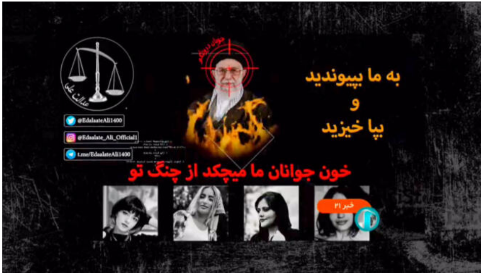
Figure 6 : Panneau au message révolutionnaire apparu lors du journal télévisé de l'IRIB, le 8 octobre 2022.

les verra également enlever les cadres avec les figures des deux guides suprêmes dans leur classe pour jouer à la marelle en sautant à pieds joints à l'intérieur des photographies. Des représentants de l'État se rendront dans les collèges espérant rétablir l'ordre avant d'être chassés sous les huées. En réponse à cette situation, des écoles de jeunes filles seront attaquées au gaz de novembre 2022 à mars 2023. Si la télévision reste un média d'État, elle sera aussi détournée. Le samedi 8 octobre 2022, un panneau s'intercale dans le journal télévisé montrant sur un fond noir le guide suprême, entouré de flammes, une cible sur le front.