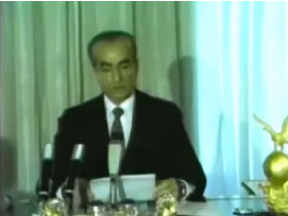
Figure 1 : Allocution télévisée du Shah, le 6 novembre 1978.

Devant la situation de plus en plus tendue, le pouvoir va faire preuve d'attitudes contraires. Du 10 octobre au 6 novembre 1978, on assiste à une libération de l'information. Cette brusque ouverture des médias confirme l'importance de la censure qui dominait jusqu'alors. Le 5 novembre 1978, l'armée intervient devant l'université de Téhéran. On parlera de « Dimanche rouge ». Du 6 novembre 1978 au 2 janvier 1979, les militaires prennent le contrôle de la télévision. Dans ce contexte, le Shah prononce un discours où il s'adresse directement à la nation : « J'ai entendu la voix de votre révolution. La révolution du peuple iranien ne peut qu'avoir mon approbation », dit-il. Cette recherche d'un dialogue apparaît comme l'aveu d'un échec. Ce sera sa dernière intervention publique.