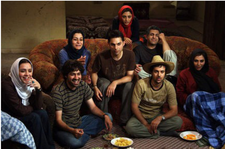
.Figure 4 : À propos d'Elly (2009) d'Asghar Farhadi

à tout espoir de changement. Le lendemain, Neda Agha-Soltan, une jeune femme de 26 ans, est tuée en pleine rue lors d'une manifestation pacifique. L'image de sa mort fait le tour du monde. Reprenant son prénom entendue sur la vidéo, elle sera d'abord surnommée « Neda Azadi » (« l'Appel de la liberté ») avant que l'on connaisse son véritable patronyme. L'image de la mort de Neda marque la fin d'une semaine de contestation. Les procès des manifestants en juillet seront diffusés à la télévision. Une surveillance accrue des gardiens de la Révolution rendra impossible la reprise immédiate du mouvement. Celui-ci ne s'éteindra pas pour autant. À partir du mois de septembre, les manifestants vont détourner la signification des fêtes officielles comme la journée de Jérusalem, le 18 septembre, ou le trentième anniversaire de l'occupation de l'Ambassade des États-Unis, le 4 novembre 2009. Le pic de la contestation sera atteint avec les cérémonies de l'Achoura. Contrairement aux attentes de nombreux Iraniens, le pouvoir parviendra à empêcher tout débordement le 11 février 2010 pour le 31 ème anniversaire de la Révolution. Un nouvel espoir apparaîtra avec les révolutions arabes en Tunisie et en Égypte les 16 et 25 janvier 2011. En réponse à cette reprise du mouvement, le régime placera les deux anciens candidats contestataires, Mir Hossein Moussavi et Mehdi Karoubi, en résidence surveillée le 14 février 2011, une situation qui est encore la leur aujourd'hui.