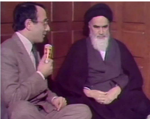
Figure 2 : Interview de Khomeini par Yves Mourousi à Neauphle-le-Château, TF1, 1979.