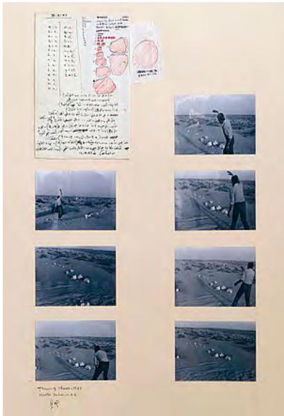
Illustration 2 Throwing Stones, 1983, photographies et encre sur papier © Hassan Sharif.