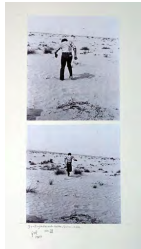
Illustration 3 Jumping in the desert, 1983, photographies © Hassan Sharif.