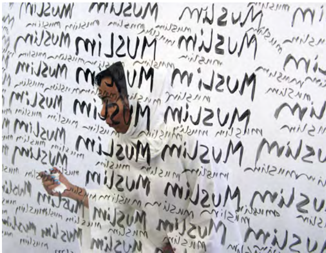
Illustration 13 Islamophobia, 2017, performance, photographies et vidéo de 8:38 minutes © Ebtisam Abdulaziz.

En 2014, Ebtisam Abdulaziz déménagea aux États-Unis avec l'idée de faire évoluer sa pratique artistique au sein d'un nouvel environnement et de s'affranchir des restrictions qui lui furent imposées – ou qu'elle s'imposa elle-même – aux Émirats arabes unis 37 . Cette relocalisation entraîna un nouveau type de questionnements sur son identité personnelle, son identité de femme arabe et musulmane et la manière dont elle est perçue par la société américaine. Réalisée en 2017 Islamophobia (ill. 12) est une performance conçue en réaction aux discours médiatiques et politiques occidentaux qui associent automatiquement islam et terrorisme. Pendant cette performance, elle se tient derrière une vitre, un marqueur à la main tandis qu'une bande son répète le mot « terroriste ». À chaque itération de ce mot, elle réplique en écrivant « Muslim ». Les extraits sonores sont tirés de discours d'hommes politiques et de journalistes américains. Derrière cette vitre, semblable à celles sans tain qui donnent une vue sur les salles d'interrogatoire, Ebtisam Abdulaziz, vêtue d'une abaya et d'un voile blancs, couleur symbole de pureté et d'innocence dans le monde occidental, tente ainsi de se défendre et de corriger ces discours. Au fur et à mesure que la vitesse de la bande-son s'intensifie, elle peine à suivre le rythme et à imposer son propre discours 38 .