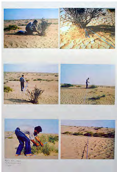
Illustration 4 Nylon Rope, 1983, photographies © Hassan Sharif.

Loin de la dimension spectaculaire de certaines performances artistiques dans lesquelles les artistes violentent, modifient ou testent les limites de leur corps, les performances d'Hassan Sharif ne possèdent pas moins une dimension critique et subversive qui peut être comprise en prenant en compte le contexte artistique, économique, idéologique et social dans lequel elles furent réalisées. La majeure