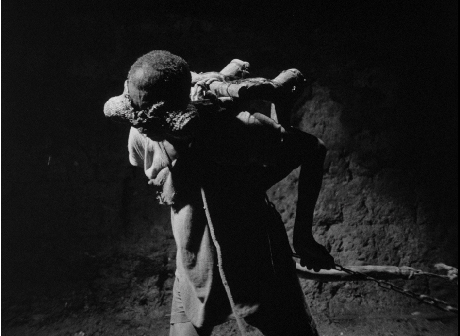
© Ibrahim Shaddad, Jamal , photogramme, 1981