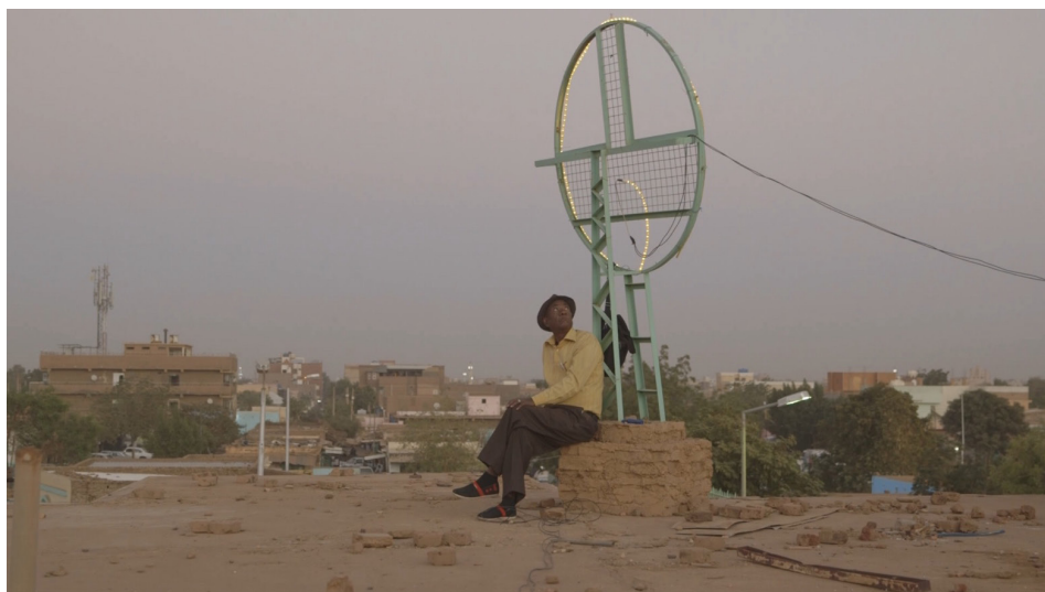
© Suhaib Gasmelbari, Talking about trees , photogramme, 2019

Le film est donc devenu une archive. On parlera plus tard de l'archive comme espace de réflexion, mais déjà aujourd'hui, il est la mémoire de ce qui n'existe plus.