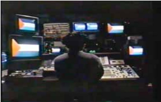
Figure 4– Photogrammes du film Hommage par assassinat