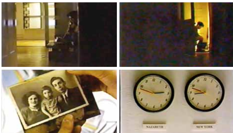
Figure 2 – Photogrammes du film Hommage par assassinat

Le silence imposé aux Palestiniens est mis en avant au début du film par la tentative ratée du journaliste qui essaye de contacter ES : « J’ai pensé contacter par téléphone un jeune cinéaste palestinien qui fait un film intitulé Hommage par assassinat . Son nom est Elia Suleiman 29 ». Or, l’appel ne se fera pas, les lignes étant coupées. Elia Suleiman, « le réalisateur palestinien » comme il se définit lui-même dans ce film, demeure silencieux, soulignant l’impossibilité de parler en tant que Palestinien. Malmené par les lignes téléphoniques, il ne peut joindre sa maison à Nazareth. Ainsi lorsqu’il compose le numéro, la voix d’une femme lui répond : « Toutes les lignes vers le pays sont temporairement déconnectées 30 ».