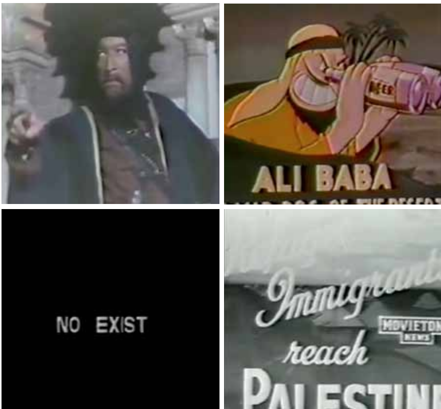
Figure 1 – Photogrammes du film Introduction à la fin d'un argument

Ainsi, dès ses débuts, Suleiman conçoit le cinéma comme un moyen de se réapproprier son image et celle des Palestiniens. À cet effet, il est essentiel pour lui de déconstruire l'imagerie dominante et de présenter des voix alternatives. Il s'attelle à cette tâche dès son premier film coréalisé avec Jayce Salloum : Introduction à la fin d'un argument : Parler pour soi-même, Parler pour les autres . À travers un montage d'extraits de films de fiction hollywoodiens et de journaux télévisés occidentaux, le film dévoile la représentation stéréotypée et péjorative des sociétés arabes et du Moyen-Orient vue par les médias occidentaux qui parlent en leur nom et au nom des autres. La confrontation de cette imagerie, prônant le même discours, souligne son aspect factice et manipulateur, et provoque ainsi sa déconstruction, tout en créant une faille à travers laquelle peuvent s'infiltrer de nouvelles voix. Elia Suleiman s'insère dans cette faille et poursuit sa quête identitaire de manière plus personnelle avec Hommage par assassinat dans lequel il incarne son propre personnage, ES, qui ne parle jamais. Dans ce film, il développe un langage cinématographique propre : sa présence silencieuse, à la fois passive et subversive, met en avant des voix alternatives qui interrogent le discours dominant et uniformisateur et déconstruit les identités nationales imposées.